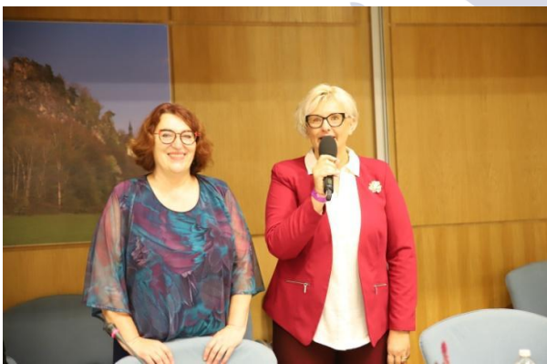
Foto z Libereckých psychologických dnů.