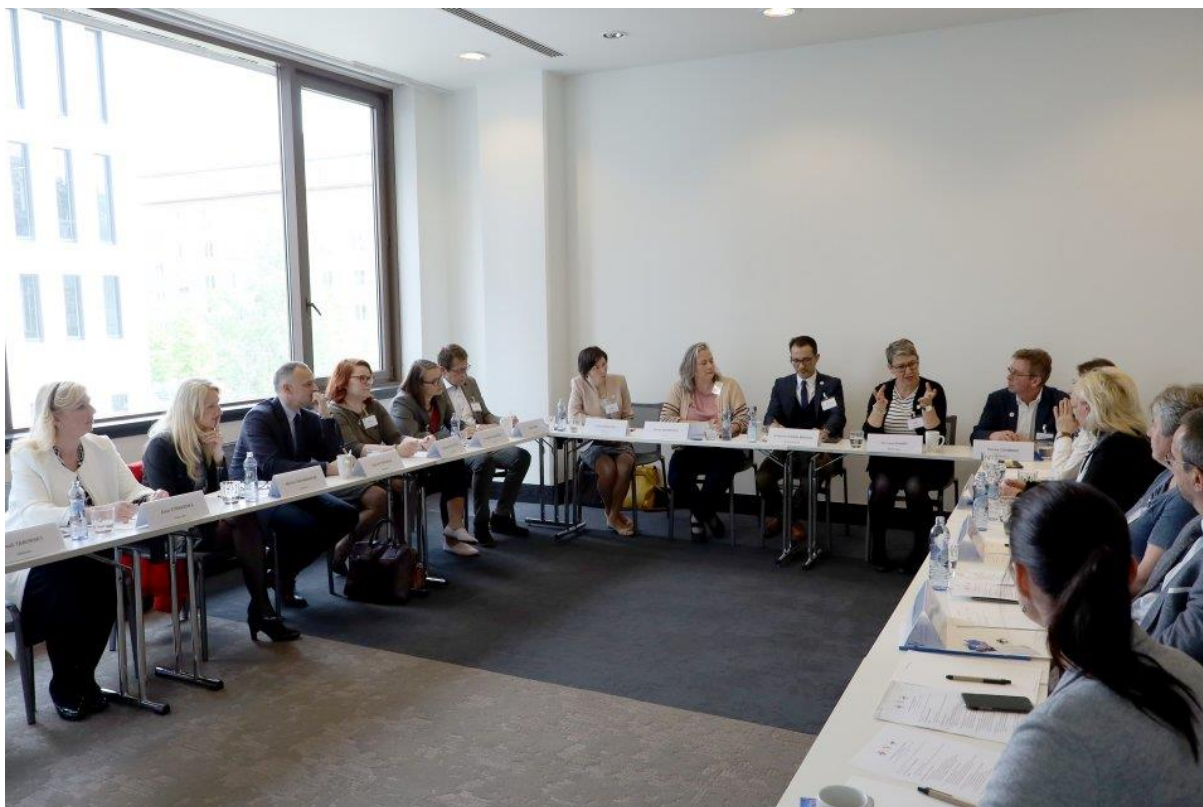
Účastníci kulatého stolu.